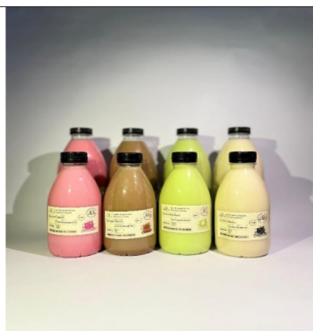
Gambar 3.4 Produk UMKM Kemasan Botol