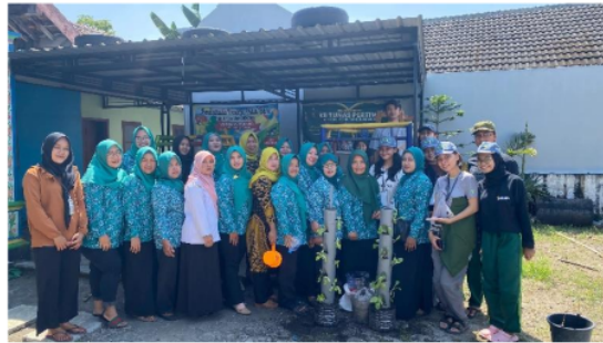
Gambar 2.1 Demonstrasi Tower Veltikultur bersama Ibu-Ibu PKK

Selanjutnya, kegiatan demonstrasi tower vertikultur diselenggarakan pada tanggal 20 Mei 2024 bersama ibu-ibu PKK di Balai Desa Setren. Dalam praktik budidaya ini, kami memberikan contoh dari awal penanaman hingga akhir yang kemudian diikuti langsung oleh ibu-ibu PKK. Bibit tanaman yang dipakai pada saat demonstrasi yakni pakcoy dan selada. Metode demonstrasi atau praktik secara langsung ini merupakan suatu metode yang mudah dipahami oleh banyak orang. Dengan tujuan agar para ibu PKK di desa Setren mengerti secara langsung perihal teknik budidaya vertikultur dan mampu mempraktikkan secara mandiri maupun sebagai kegiatan rutin organisasi tersebut.