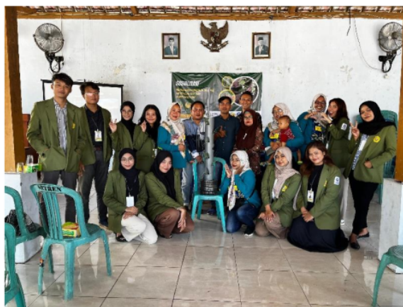
Gambar 1.1 Sosialisasi Taman Sekar Wangi dan TTG bersama Ibu-Ibu PKK

Kegiatan sosialisasi Penghijauan Balai Desa “Taman Sekar Wangi” dan Teknologi Tepat Guna ( Tower Veltikultur ) dilaksanakan pada hari Kamis, 16 Mei 2024 di Balai Desa Setren dengan turut mengundang kepala desa, anggota PKK, dan perangkat desa. Dalam sosialisasi ini dimulai dengan pembukaan, sambutan kepala desa dan ketua kelompok, pengenalan kelompok, pemaparan latar belakang, tujuan kegiatan, pengertian teknologi tepat guna, teknik budidaya veltikultur, dan tata cara pembuatan tower veltikultur dari paralon. Setelah penjelasan materi dari kami, para undangan yang hadir khususnya ibu-ibu PKK merasa antusias untuk bertanya dan mencoba budidaya vertikultur. Kegiatan ini sangat penting dilakukan guna mempermudah menyampaikan informasi, pengetahuan, peningkatan kesadaran atas isu lingkungan, partisipasi masyarakat khususnya keterlibatan perempuan desa.