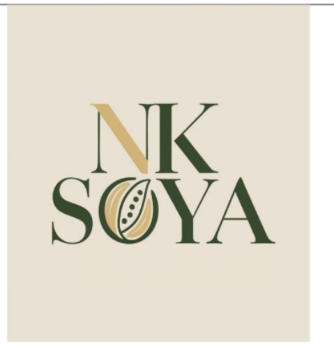
Gambar 3.2 Logo Produk UMKM Setelah Rebranding