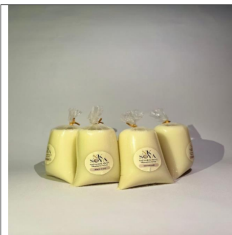
Gambar 3.3 Produk UMKM Kemasan Kecil