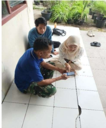
Gambar 1. Pendampingan Penerapan Digital Marketing

Pada platform Whatsapp kami menyarankan agar membuat Whatsapp khusus juga seperti Whatsapp bisnis yang tujuannya sebagai contact person apabila orang lain ingin menghubungi Kelompok Tani Urban Farming “Keputih Bersemi” untuk suatu keperluan. Keberadaan WhatsApp tersebut kemudian dapat ditaruh di bio Instagram sebagai contact person agar orang mudah untuk mengetahui jika ingin menghubungi kelompok tani. Kemudian, pada platform instagram kami juga memberikan arahan agar lebih interaktif yakni pada bagian bio kami sarankan untuk menuliskan namakelompok tani secara lengkap agar orang bisa mengetahui saat sedang melakukan pencarian. Kemudian detail lokasi dan koordinat pasti pada google maps juga kami cantumkan agar orang lain mengetahui lokasi pasti Kelompok Tani Urban Farming “Keputih Bersemi” apabila ada suatu keperluan untuk datang ke lokasi. Lalu, bagian akhir yakni mencantumkan contact person Whatsapp pada rincian bio Instagram agar jika ada orang yang ingin memesan produk ( order ) bisa langsung menghubungi orang terkait dan dalam hal ini pak ikhsan selaku koordinator kelompok tani bersedia untuk mencantumkan nomornya apabila ingin dihubungi.