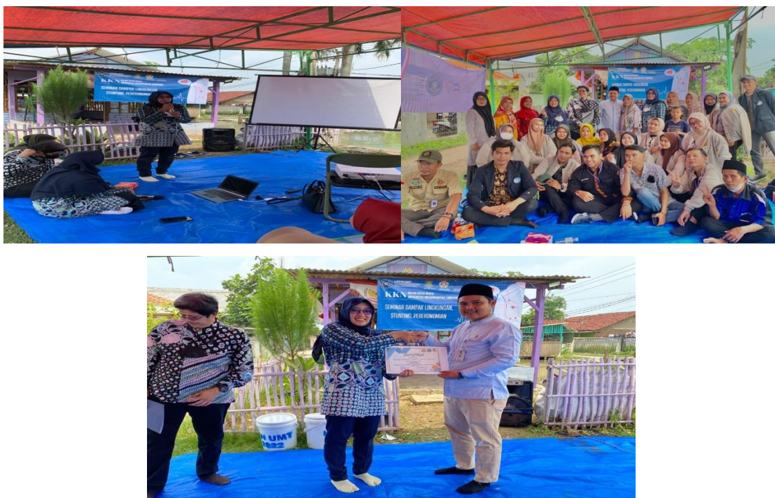
Gambar.4. Silaturahmi Masyarakat dan Mahasiswa