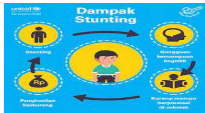
Gambar .2. Dampak Stunting

c. Kemiskinan Siklus Generasi: Stunting dapat menghasilkan siklus kemiskinan antargenerasi. Anak-anak yang mengalami stunting cenderung memiliki kesempatan pendidikan dan pekerjaan yang lebih terbatas, mempertahankan siklus kemiskinan di keluarga mereka dan mengganggu pertumbuhan ekonomi suatu masyarakat secara keseluruhan