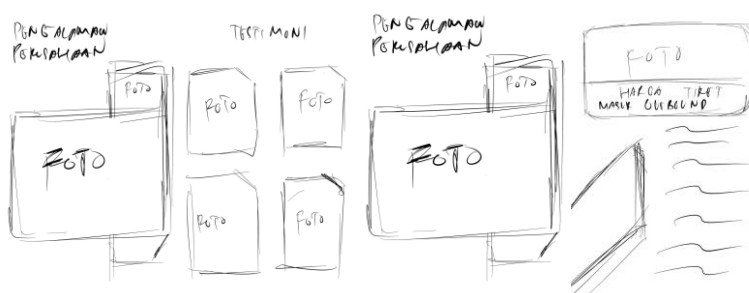
Gambar 6. Buku Profil