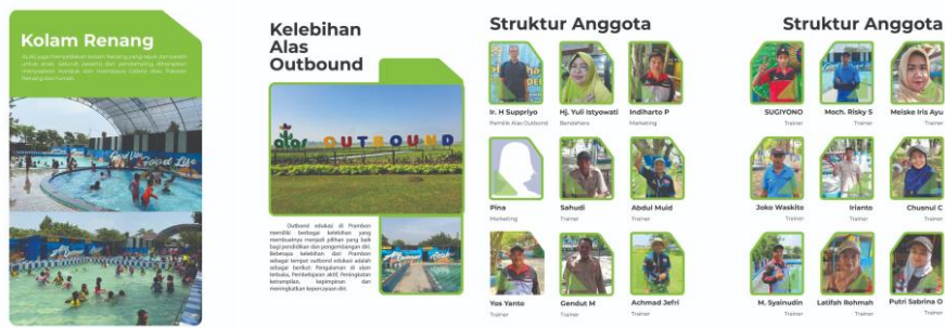
Gambar 10. Buku Profil