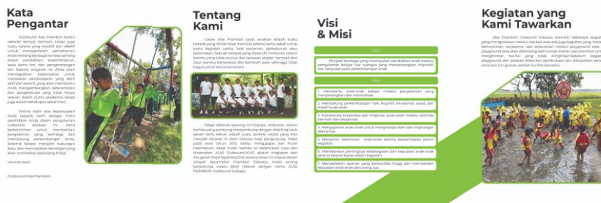
Gambar 8. Buku Profil