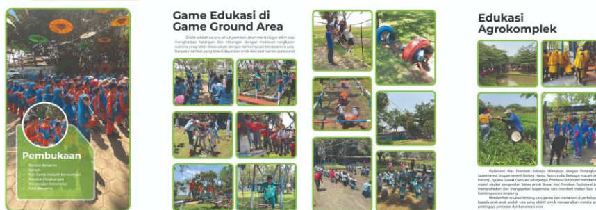
Gambar 9. Buku Profil