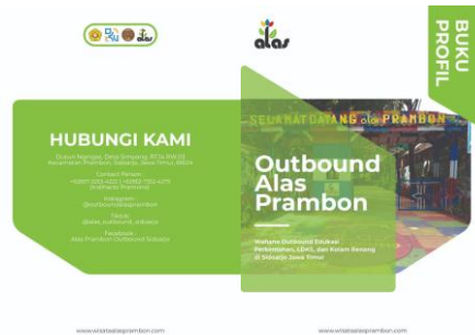
Gambar 7. Buku Profil (Dokumentasi Pribadi, 2023)