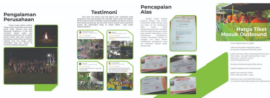
Gambar 11. Buku Profil