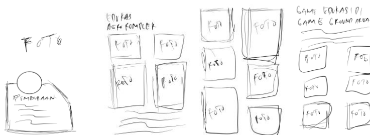
Gambar 4. Buku Profil