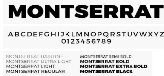
Gambar 1. Font MONTSERRAT

Jenis huruf yang dipakai dalam perancangan diantaranya jenis huruf yang sesuai dengan desain yang dibuat yaitu ; monserrat, monserrat bold