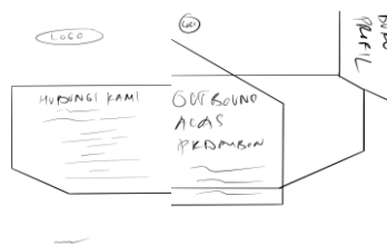
Gambar 2. Buku Profil (Dokumentasi Pribadi, 2023)