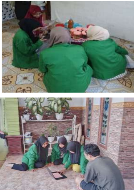
Gambar 1 awal Pendampingan Awal Pembuatan NIB.