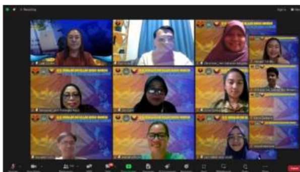
Gambar 4: Model Pembelajaran AKIK melalui Aplikasi Zoom

Melalui menerapkan model pembelajaran AKIK, diharapkan proses pembelajaran dapat lebih menginspirasi dan memberdayakan mahasiswa untuk menjadi pembelajar yang mandiri, kreatif, dan mampu berkomunikasi efektif.