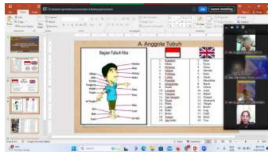
Gambar 1: Model Pembelajaran AKIK melalui Aplikasi Zoom

Model pembelajaran AKIK adalah pendekatan yang menekankan pada aktivitas aktif, komunikatif, interaktif, dan kolaboratif dalam proses pembelajaran. Berikut adalah penjelasan tentang setiap tahapan penerapan model AKIK.