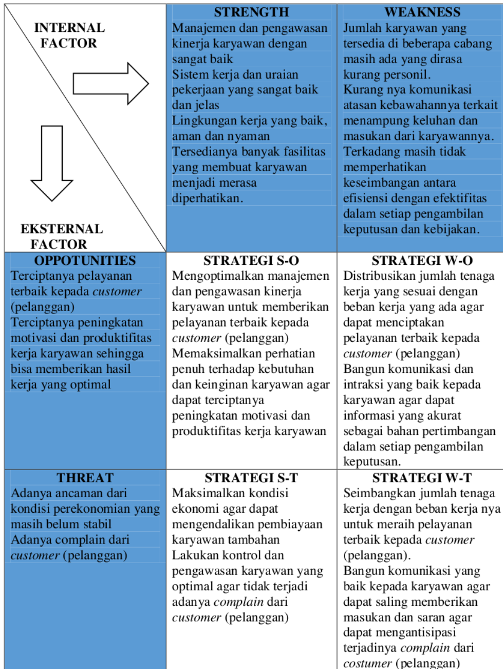
Tabel 2. Pilihan Strategi Matrik SWOT dan TOWS