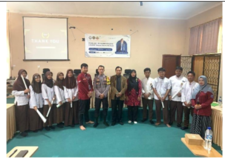
Gambar 3. Foto Bersama Kegiatan Seminar Hukum Bahaya Judi Online

Acara dibuka oleh sambutan Kepala Sekolah SMAN 3 Kota Cilegon, kemudian dilanjutkan pemberian materi bahaya judi online dari pihak kepolisian serta pemateri dari pakar hukum. Acara ini dihadiri oleh pihak sekolah baik guru dan siswa SMAN 3 Cilegon, mahasiswa KKM 42 Bulakan, serta pemateri baik dari pihak kepolisian dan pakar hukum. Siswa SMAN 3 Kota Cilegon antusias akan seminar hukum ini yang dibawakan tidak terlalu serius dan berat, sehingga memancing para peserta untuk bertanya seputar judi online slot yang sedang tren di kalangan remaja yang sudah terkontaminasi dan lingkungan yang mempunyai factor terbesar pada judi online ini