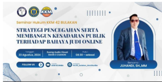
Gambar 1. Spanduk Seminar Hukum Bahaya Judi Online