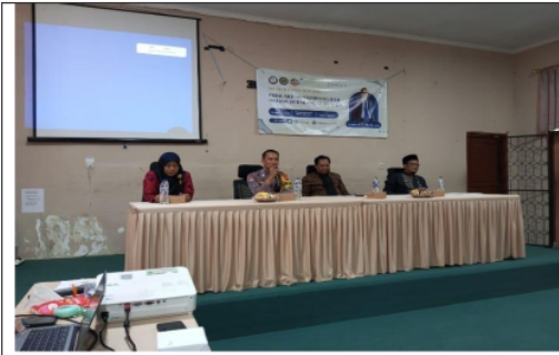
Gambar 2. Foto Kegiatan Seminar Hukum Bahaya Judi Online