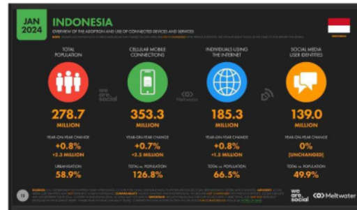
Gambar 1 Data Penggunaan Digital Indonesia 2024

perilaku konsumtif. Perilaku konsumtif adalah kegiatan konsumsi yang dilakukan secara berlebihan dan barang yang dibeli tidak didasarkan pada kebutuhan (Kartika, 2022).